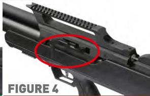
FIGURE 4 Secondary Safety Passive