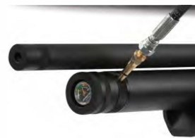
Obrázek č. 8

Utáhněte pomocí klíče, nikoli jen rukou.