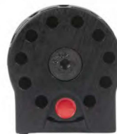
Obrázek č. 15

Po vložení první diabolky otáčejte zásobníkem proti směru hodinových ručiček a vkládejte další diabolky.