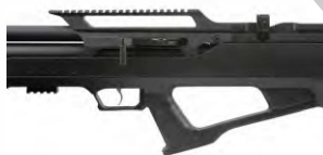
Obrázek č. 21

Poznámka: Přemístěním šroubu na spodní straně zásobníku nastavíte, z které strany jej budete vkládat.