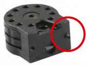
Obrázek č. 20

Poznámka: Přemístěním šroubu na spodní straně zásobníku nastavíte, z které strany jej budete vkládat.