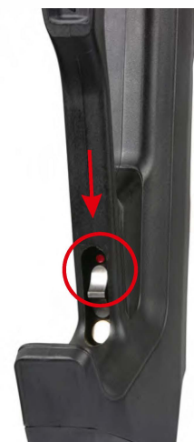
Primary Safety Passive