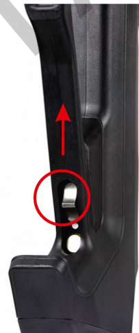
Primary Safety Active

Bezpečnostním tlačítkem nelze pohybovat, pokud není závěr natažen.