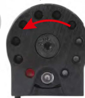
Obrázek č. 14

Vložte první diabolku do většího otvoru dole, hlavičkou napřed!