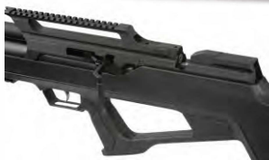
Obrázek č. 17

Natáhněte nabíjecí páku do její úplné zadní polohy. Zbraň mějte zajištěnou.