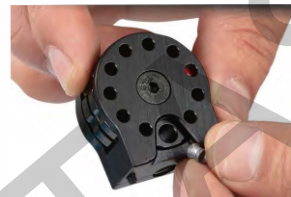
Obrázek č. 13

Vložte první diabolku do většího otvoru dole, hlavičkou napřed!