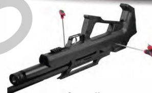
Obrázek č. 23

Vyšroubujte šrouby na spodní a pravé straně pažby pomocí imbusového klíče, abyste pažbu sundali.