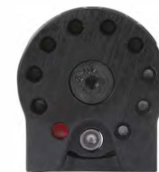
Obrázek č. 16