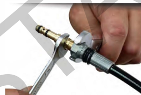
Obrázek č. 7

Propojte plnicí pin s hadicí plnicího zařízení (obr. 5 a 6)