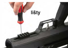
Obrázek č. 24

Chcete-li montážní lištu Picatinny přesunout dopředu/dozadu, uvolněte šrouby imbusovým klíčem a utáhněte je, když je lišta v požadované poloze.