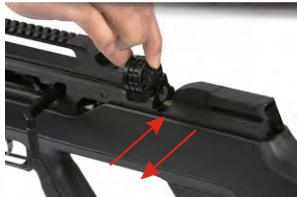
Obrázek č. 18