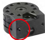
Obrázek č. 19