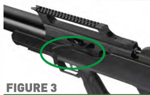
FIGURE 3 Secondary Safety Active

Vaše puška je kromě primární bezpečnosti (hlavní pojistkou) vybavena pojistkou natahovací páky. Natáhněte napínací rukojeť pouze o jednu polohu, aby se aktivovala pojistka napínací rukojeti, jak je vidět na následujícím obrázku 3.