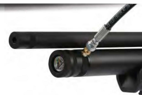
Obrázek č. 9